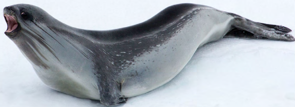
PHOQUE DE ROSS Ommatophoca rossii